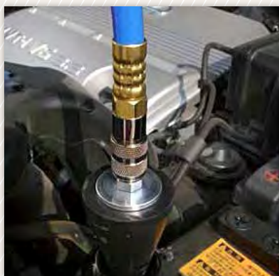
Zestaw Vacuum Coolant Refiller pracuje w zakresie od 0 do 8 bar